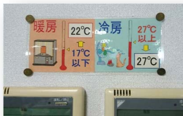
空調温度適正化の継続 (冷房27℃、暖房22℃)