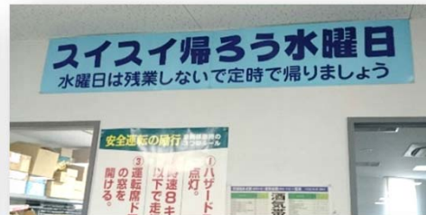
毎週水曜日のノー残業デーを継続